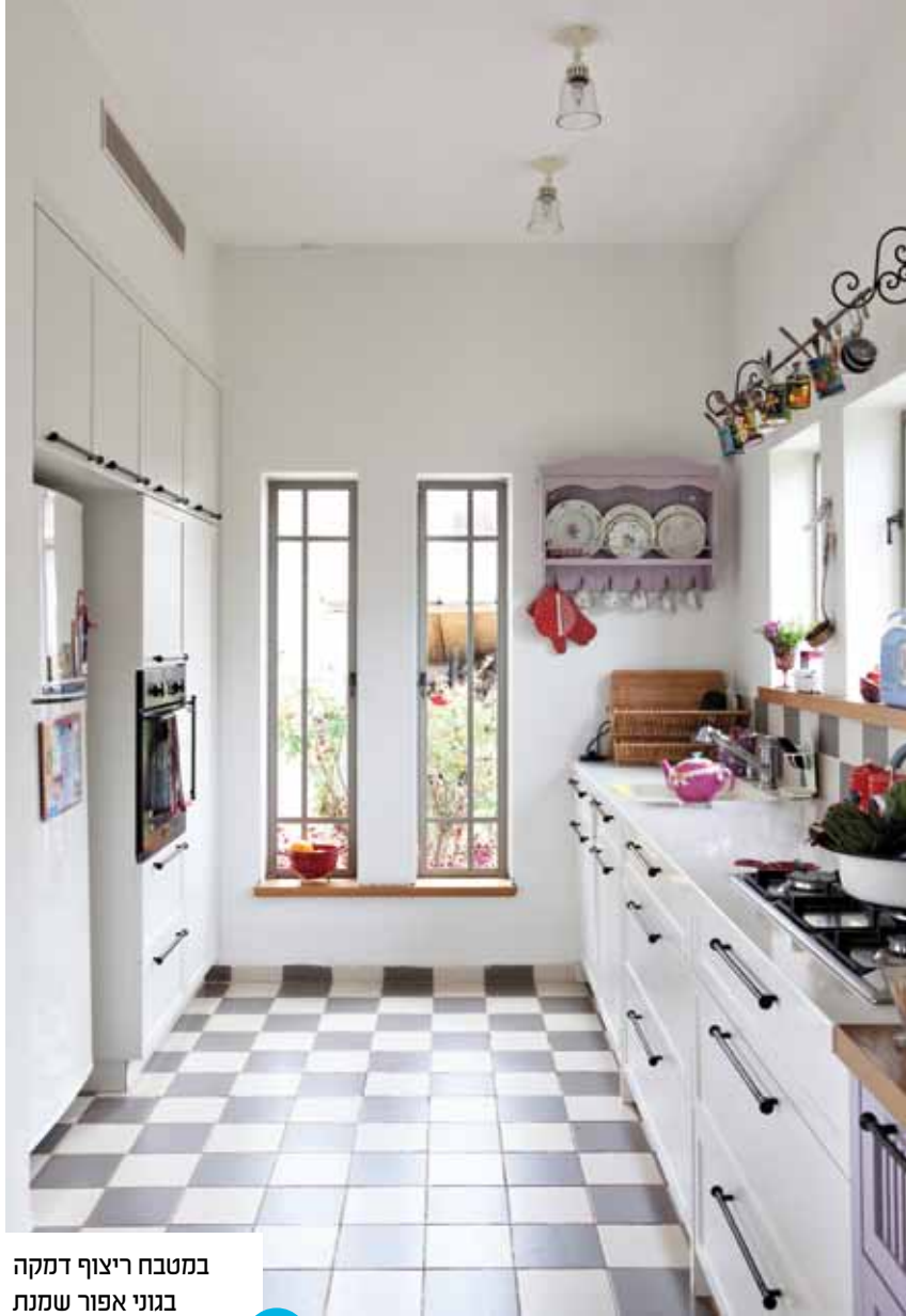
במטבח ריצוף דמקה בגוני אפור שמנת שמקפיץ את האווירה, ונגיעות עדינות בצבע הסגול האהוב על שירי, מופיעות בשתי השידות.